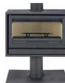
Opção base Slim.