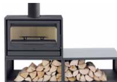
Opção base Duo.